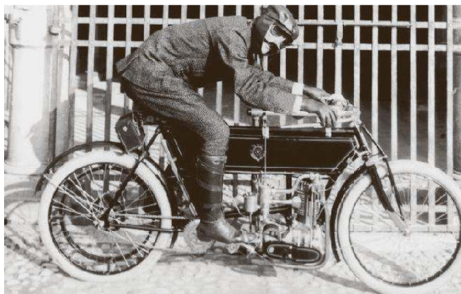
Una delle fotografie esposte a San Giusto dell'archivio Alinari

Si legga, per favore, qualche piacevole storia della fotografia, non necessariamente la mia, per scoprire come, da circa centottanta anni, le vicende del mondo siano collegate all'invenzione della Fotografia, accanto a quelle dell'Elettricità, del Vapore, dell'Elica, del Telegrafo, del Telefono, delle Strade Ferrate e, infine, dei Jet, "più pesanti dell'aria". E poi, "verso l'invisibile" dei Raggi X, il Cinematografo, la