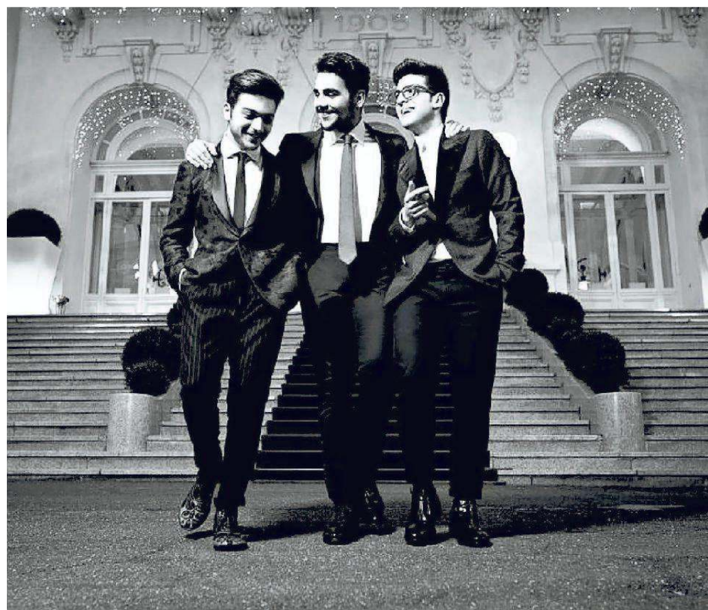
I due concerti dell'estate palmarina: il 29 giugno con Battiato e l'8 luglio con Il Volo

carriera artistica di Battiato che si arricchiscono con un impianto scenico che ne esalta la storia musicale. Una notizia che farà sicuramente felici i tanti fan del Maestro, pronti ad accoglierlo in migliaia anche nella nuova data del 29 giugno a Palmanova.